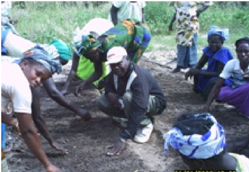
les femmes capacités en technique de préparation des planches