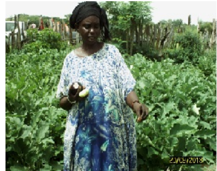
les femmes à l'heure de la récolte