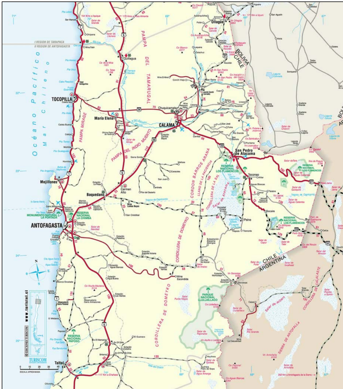
Figura A.1.1: Mapa Región de Atacama